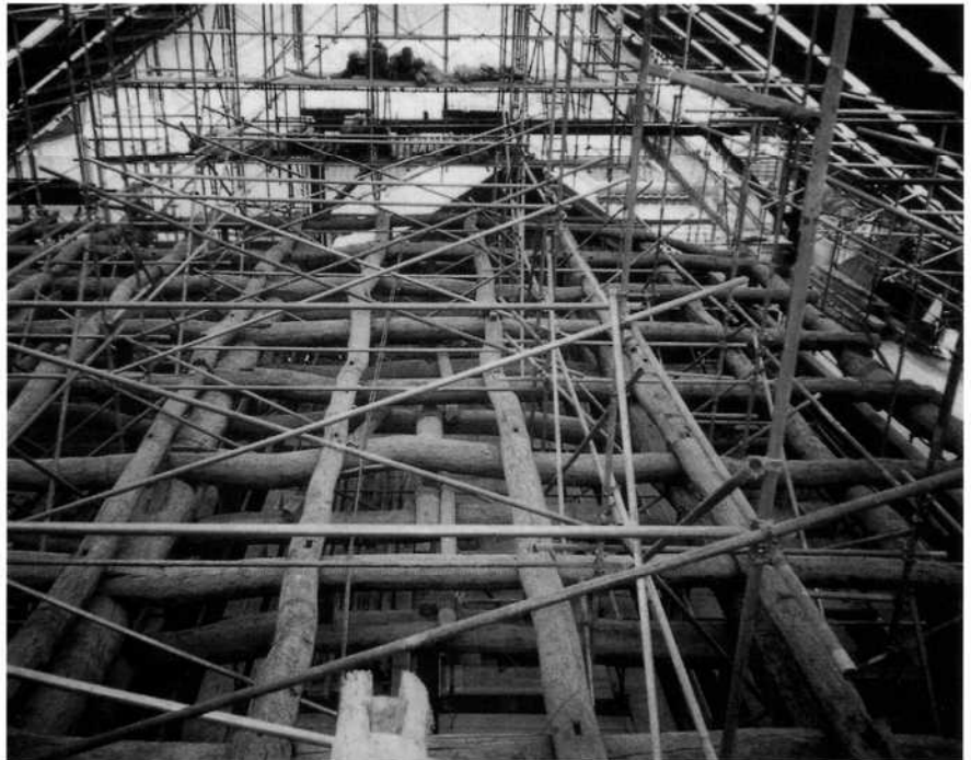
写真3 貞永寺本堂梁組

おり、当初はそのつもりで調査を開始したが、調査が進むにつれて江戸時代中期頃に大規模な改修を施したか、または建て替えられたのかもしれないという見方が強くなってきた。そこに至るまでは、各部分材の詳細な調査を積み重ね、それらを総合した広い範囲に互る可能性に基づき、慎重なストーリーを構築しなければならない。これには相当な根気が必要であり、かつ大胆な推理力も併せて要求される。このような素養を、多くの会員に修得してもらいたいものである。そのような会員が増えることによって、さらに様々な活動へと発展するであろう。