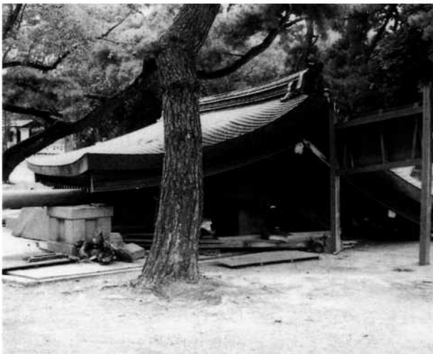
写真1 被災直後の手水舎

各指定建造物以外にも、それらに準ずる歴史的建造物は、その何倍もの数が存在しているので、一旦大規模な地震が発生すると被害は膨大な量になるであろう。危険地域内やその近隣に建つ歴史的建造物の所有者・管理者は、以上のことを考慮して、予想される大規模地震に対応しなければならないと考えられる。