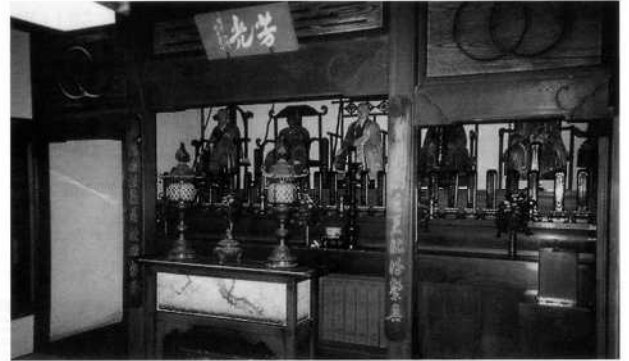
静居寺開山堂内部