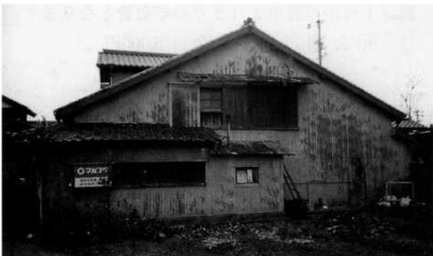
川越遺跡立合宿現状

大震災時仏像彫刻においては、足元の柄が長くしっかりと台座に差し込まれていたものは倒壊を免れたと伝えられる。木造建造物においてもあまり金物