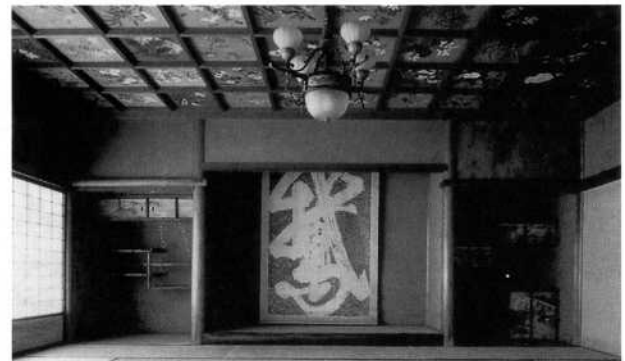
楽寿館楽寿の間