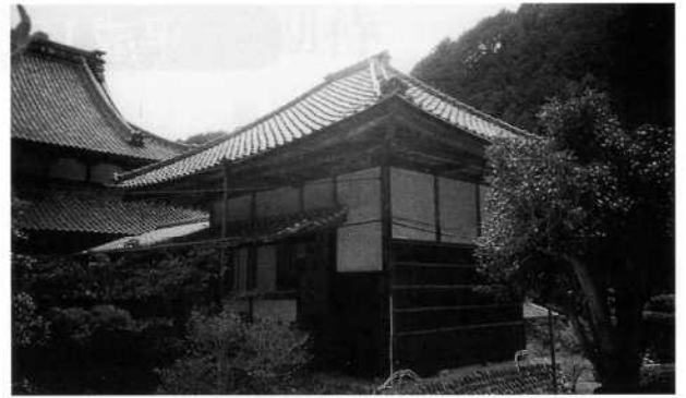
静居寺開山堂外観