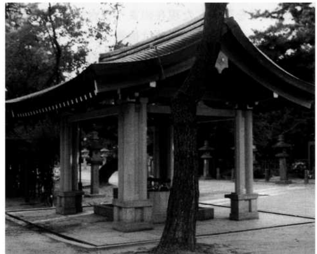
写真2 復旧後の手水舎