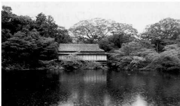
楽寿館遠景

こうした中で、今回の法人化に依る意義を認識され、木造建築の文化を守るため民家、社寺、数寄屋を始めこれらに付属する庭園や、林業に係る一切の日本伝統建築の愛護、啓蒙のため更なる活躍を期待すると共に、会の隆盛と会員の一層の健康と発展を御祈念致します。